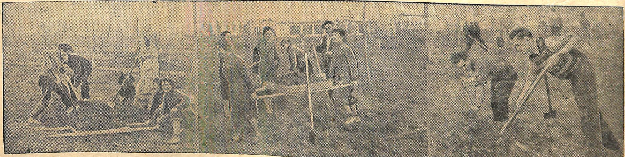
На снимках: молодежь на субб отнике, организованном комсомольской организацией (комсорг т. Маринин) по благоустройству парка.